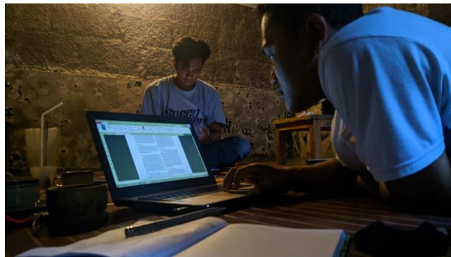
Gambar 2. Tim diskusi bersama

Diskusi dilakukan untuk mendengarkan permasalahan tim. Berdasarkan diskusi yang dilakukan, diketahui bahwa tim menginginkan keterampilan yang dapat dilakukan di sela-sela aktivitas perkuliahan untuk membantu perekonomian keluarga.