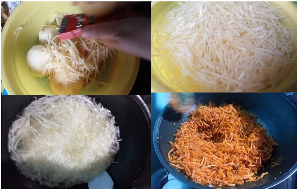
Gambar 3. Proses pembuatan kentang mustofa

Pengolahan kentang mustofa dilakukan dari mulai pengupasan kentang, kentang diparut, dicuci, digoreng, dikeringkan, diberi bumbu, hingga dikemas.