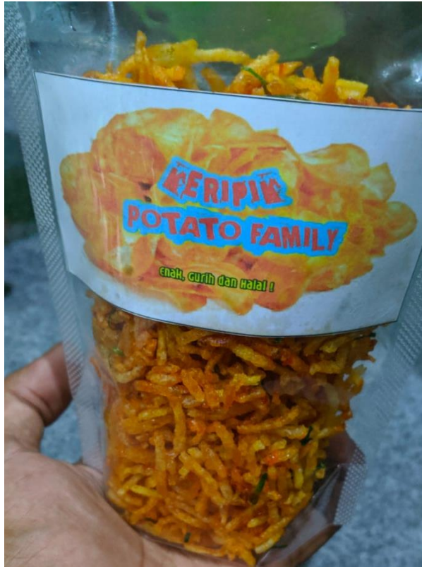
Gambar 3. Pengemasan dan Label

Pengemasan dilakukan dengan memasukkan kentang mustofa dalam kemasan dengan berbagai ukuran, yaitu 150 ml, 250 ml, dan 350 ml. Fariasi ini bertujuan agar konsumen dapat membeli kentang mustofa sesuai kebutuhan.