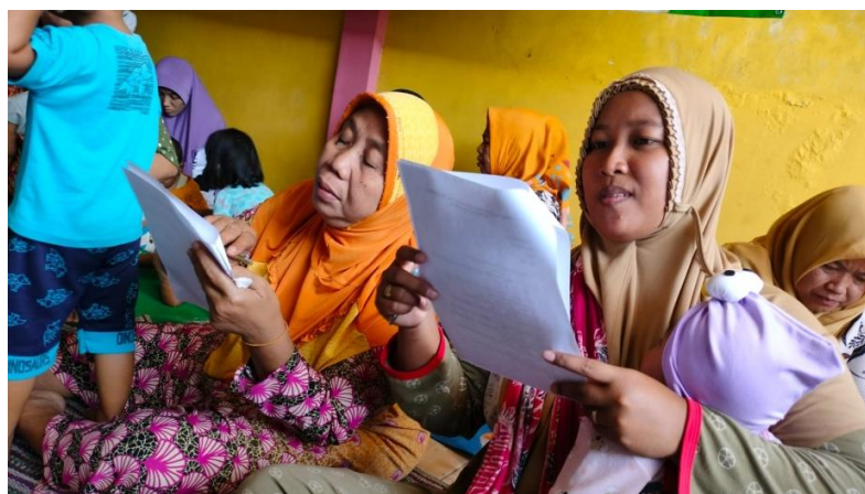
Gambar 5. Pengisian Kuisisioner oleh Peserta Parenting

Sambutan pertama oleh dosen pembimbing lapangan Bpk. Miftakhur Ridlo, S.Hum., M.Fil.I. dan sambutan yang kedua oleh kader posyandu Ibu Rahayu, dilanjutkan dengan pembacaan do'a oleh saudara Hamzah Maulana. Penyampaian materi oleh Ibu Tinuk Suparti, M.Pd. menggunakan teknik ceramah dan diskusi antar peserta. Diakhir kegiatan peserta diberikan kuisisioner untuk mengisi penilaian terhadap pelaksanaan yang telah diberikan dan peningkatan kemajuan dirisetelah mengikuti proses pelatihan dari awal hingga selesai