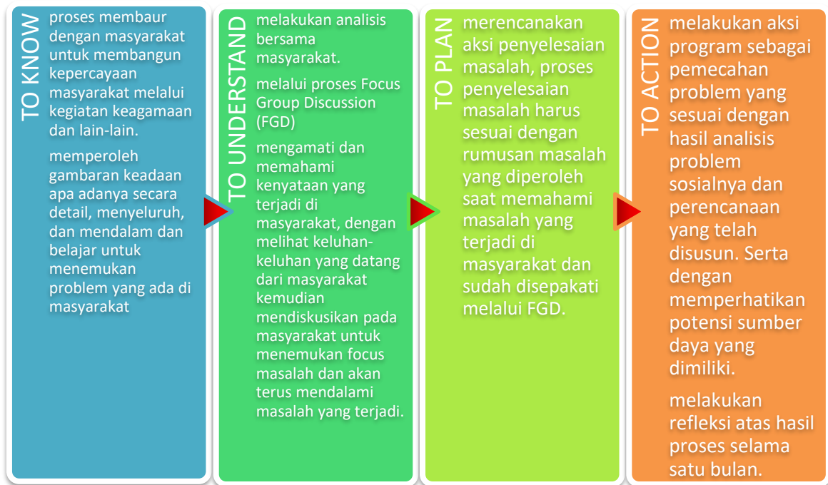
Tabel 1. Metode Participatory Action Research (PAR)