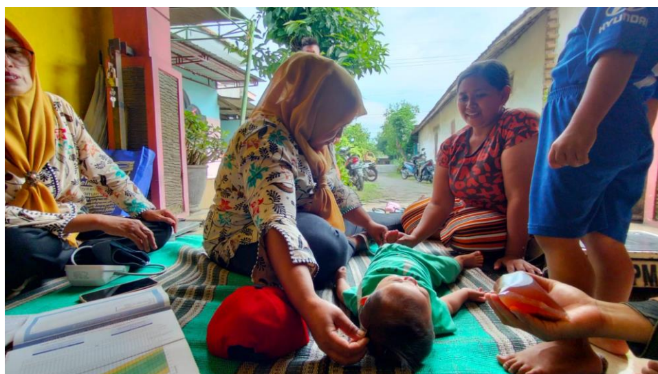
Gambar 1. Penimbangan posyandu balita

Di Desa Ngrowo terdapat kegiatan rutin posyandu yang dilakukan setiap bulan karena banyaknya jumlah penduduk di Desa Ngrowo, posyandu balita di bagi menjadi 5 pos, yakni di balai dusun Tawang Sari, di RT 22 Dusun Pendowo, di rumah Bapak kadus Ngranggon, di rumah Ibu Kades, dan terakhir di rumah Ibu Isminafik di RT 10 Dusun Pendowo. Posyandu dilaksanakan setiap 1 bulan sekali dan terdapat program pemberian vitamin A di bulan Februari dan bulan September.