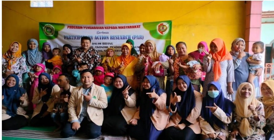
Gambar 7. Dokumentasi Pasca Kegiatan Parenting

Harapannya setelah adanya parenting ini orang tua menjadi lebih paham tentang bagaimana peran orang tua dalam pengawasan dan pemantauan orang tua terhadap aktifitas anak dalam penggunaan media digital. Orang tua menjadi lebih bijak dalam pemberian gadget terhadap anak dan juga parenting ini akan membantu orangtua yang memiliki kesulitan dalam menerapkan pola asuh yang benar terhadap anak, menambah wawasan orangtua dalam ilmu pengasuhan dan psikologi juga kesehatan anak. Dengan adanya kegiatan parenting ini dapat menumbuhkan pola asuh yang benar baik secara pendidikan maupun psikologis terhadap anak bertambahnya wawasan orangtua tentang berkembangnya zaman maka berkembang pula wawasan mereka terhadap cara pola asuh yang positif dan melihat respon positif dari semua belah pihak maka kegiatan ini seharusnya wajib diadakan oleh setiap institusi pendidikan agar terjaminnya masa depan anak (Nooraeni, 2017).