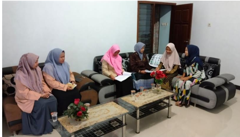
Gambar 4. Koordinasi dengan Kader Posyandu