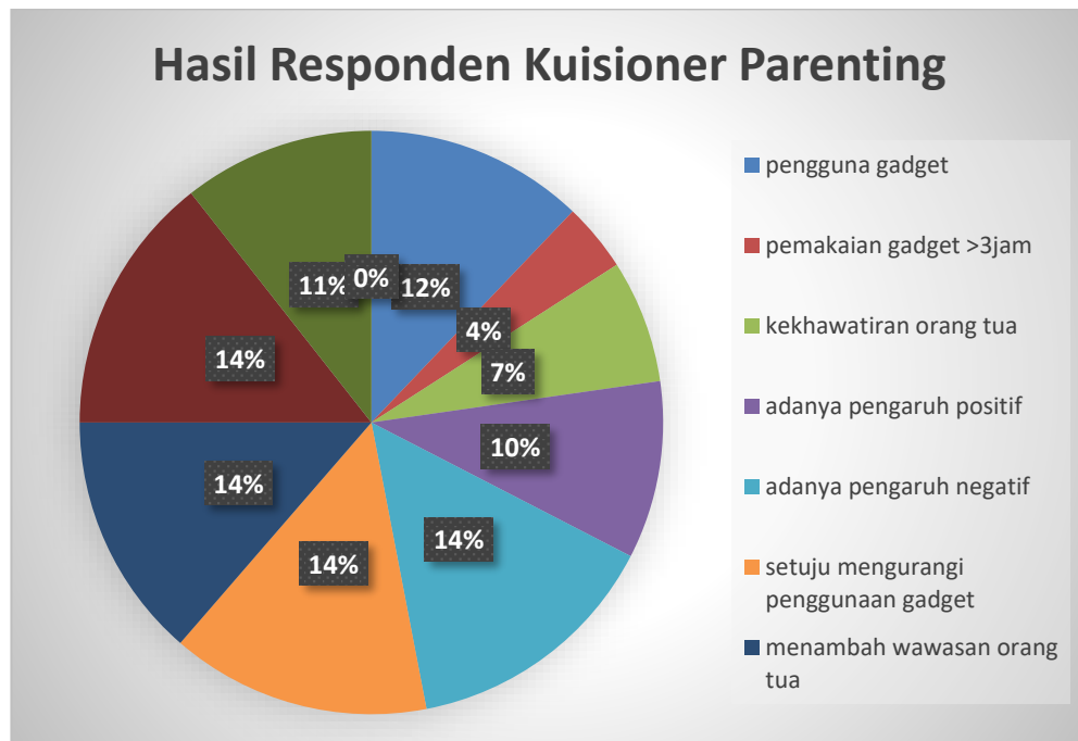
Tabel 3. Diagram Hasil Kuisisioner Parenting

Hasil dari keberhasilan kegiatan parenting ini dapat dilihat melalui evaluasi kegiatan parenting berupa pertanyaan dalam bentuk kuesioner sebagai berikut: