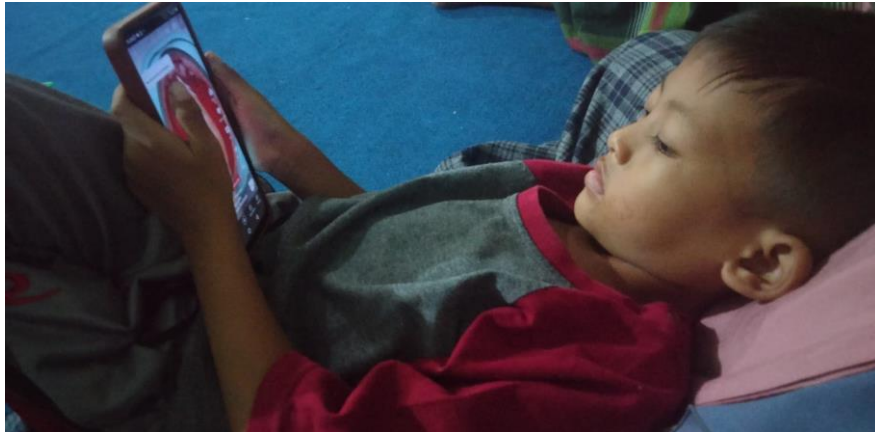
Gambar 3. Anak Pengguna Gadget

Dari penjelasan di atas dapat disimpulkan bahwa sekarang ini banyak sekali anak-anak bahkan di usia yang masih sangat dini sudah menggunakan gadget di keseharian mereka di karenakan kurangnya pemahaman orang tua tentang pengaruh negatif terhadap penggunaan gadget. Begitupun di desa Ngrowo banyak anak usia dini yang sudah ketergantungan dengan gadget dan para orang tuapun sama sekali tidak memberi batasan penggunaan gadget tersebut.