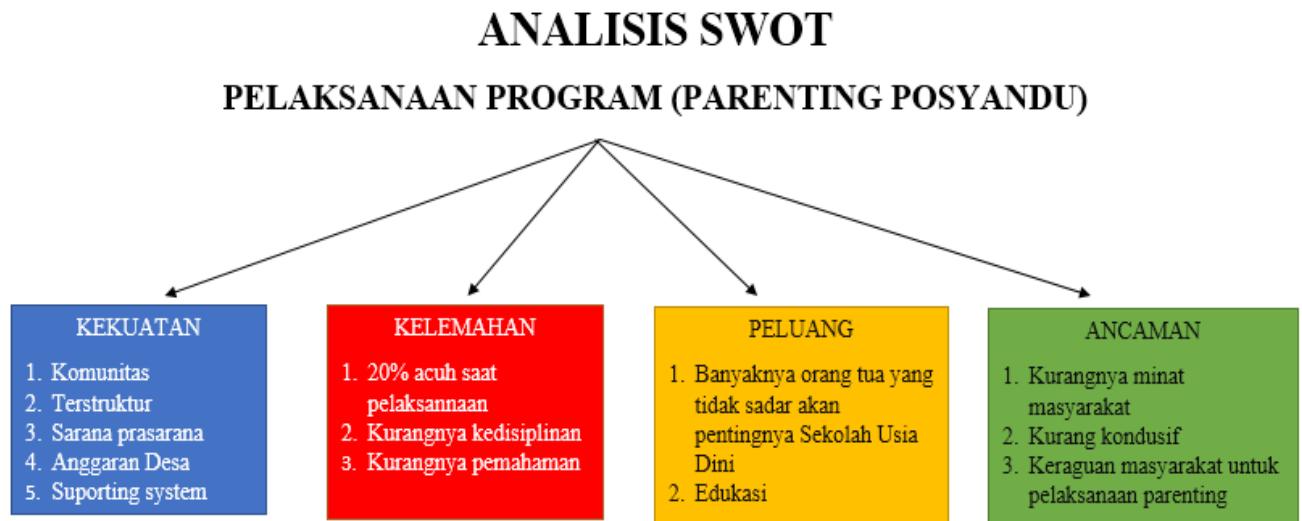
Gambar 8. Analisis SWOT Pasca Pelaksanaan Parenting

Melihat dari analisis di atas dapat disimpulkan bahwa agar hasil dari pelaksanaan parenting tersebut dapat menambah wawasan para orang tua dalam memahami tentang dampak negatif penggunaan gadget dan dapat mengatasi kecenderungan terhadap gadget.