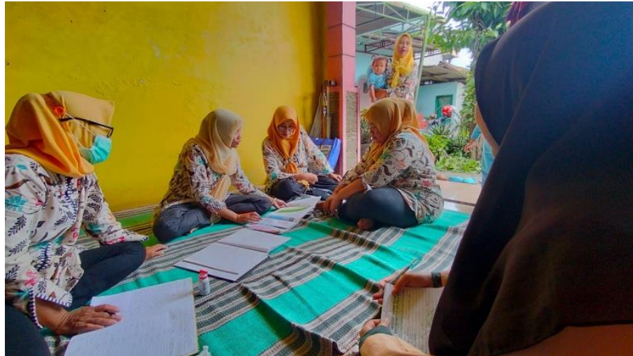
Gambar 2. Posyandu Balita

Pendowo. Posyandu dilaksanakan setiap 1 bulan sekali dan terdapat program pemberian vitamin A di bulan Februari dan bulan September.