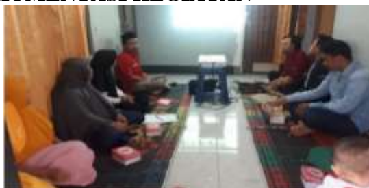
Kegiatan Pengabdian Masyarakat