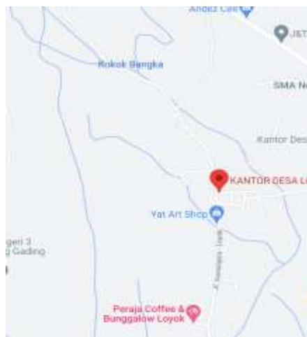
Gambar 1. Lokasi Mitra

Mitra dari kegiatan Pengabdian Kepada Masyarakat ini adalah pengrajin anyaman bambu di Desa Loyok Kecamatan Sikur Kabupaten Lombok Timur. Lokasi mitra ditampilkan pada Gambar 1.