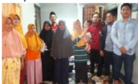
Peserta Kegiatan Pengabdian Masyarakat