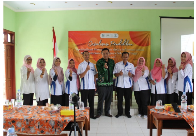
Foto bersama Guru SMA PGRI Sendang