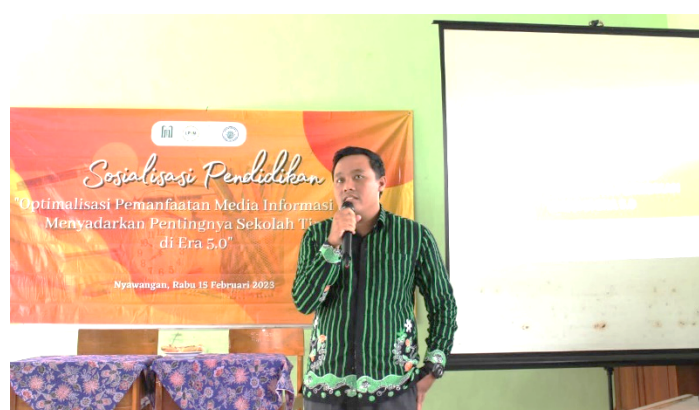
Gambar 3. Pengabdian dalam bentuk Sosialisasi

Kegiatan pengabdian dikemas dalam bentuk kegiatan formal yakni diawali dengan sambutan-sambutan dari pimpinan lembaga terkait. Kemudian dilanjutkan dengan kegiatan pengabdian yakni penyampaian materi mengenai pendidikan tinggi kepada seluruh partisipan generasi Z.