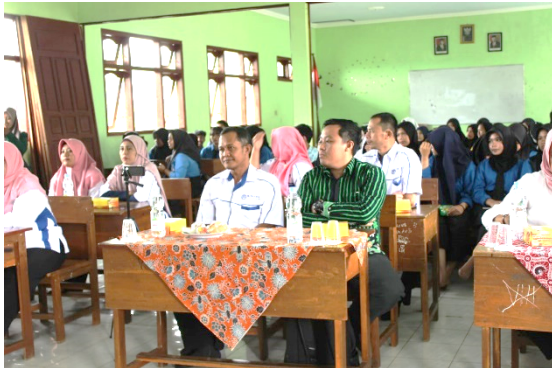
Pembukaan Kegiatan Pengabdian