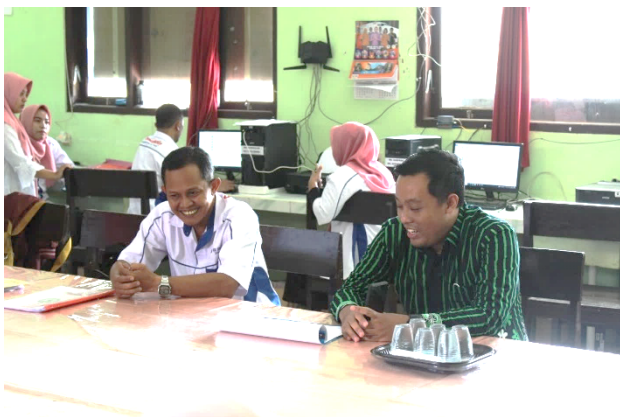
Gambar 2. Konsultasi dengan Kepala Sekolah

Kegiatan pengabdian masyarakat ini dilaksanakan di SMA PGRI Sendang dengan jumlah peserta 75 orang baik putra maupun putri. Kegiatan pengabdian dikemas dengan bentuk sosialisasi atau pembekalan dengan tema pendidikan tinggi. Sebelum melakukan pengabdian tentu tim pengabdian melakukan konsultasi dengan pihak pengelola sekolah akan kesiapan peserta atau partisipan sebelum menerima materi.