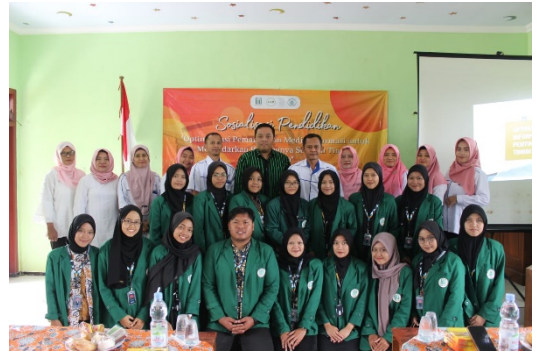
Foto bersama Panitia dan Guru