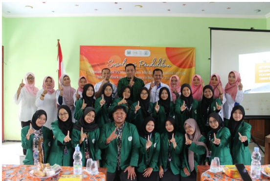
Foto bersama panitia dan Guru