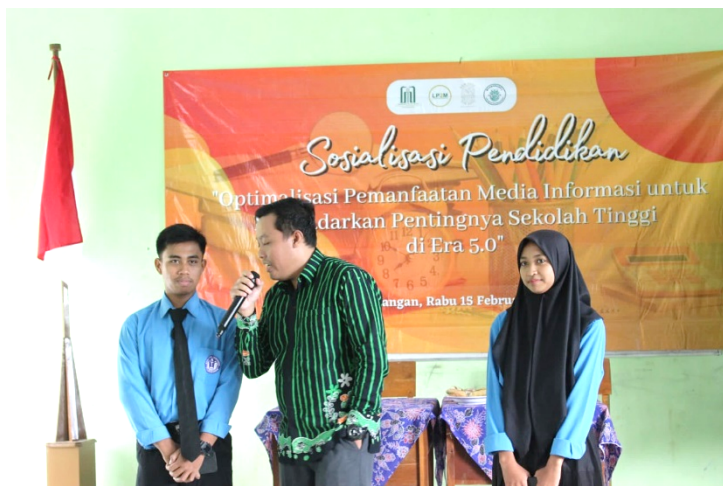
Gambar 4. Tanya Jawab dengan Partisipan

Pada saat materi disampaikan, pemateri atau tim pengabdian akan melakukan tanya jawab kepada para partisipan. Tanya jawab dilakukan 2 tahap yakni disela-sela materi dan di akhir materi sesuai pada gambar 4. Tanya jawab tidak hanya dalam bentuk memberikan pertanyaan kepada partisipan, namun tanya jawab dapat berupa pola komunikasi yang bertujuan memberikan stimulus kepada para partisipan supaya materi atau informasi dapat diterima dan dipahami dengan baik.