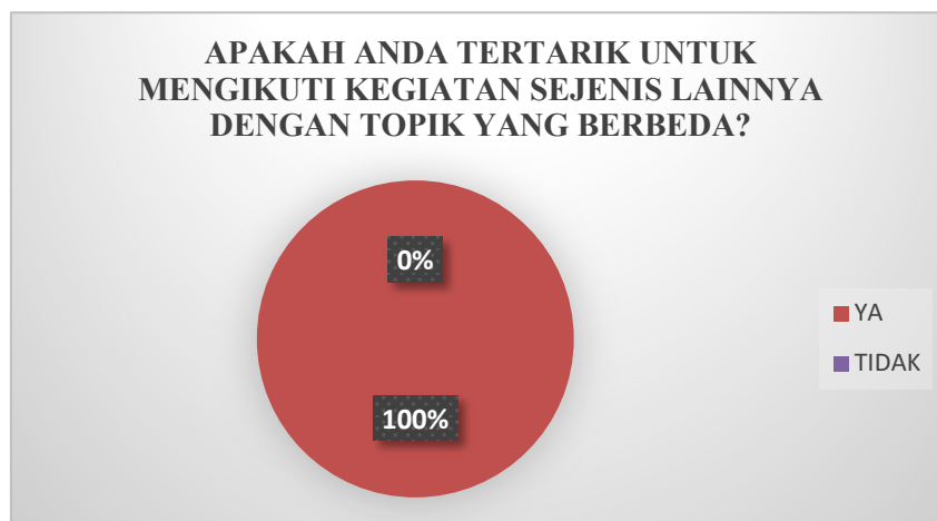
Gambar 6. Hasil Instrumen Kepuasan Peserta Pertanyaan No 4