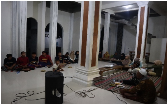
Gambar 7. Pemaparan materi