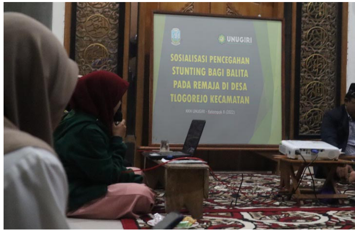
Gambar 2. Pelaksanaan sosialisasi pencegahan Stunting

Kegiatan pertama adalah pembukaan dari moderator dan dilanjutkan dengan mempersiapkan peserta dengan ice breaking agar peserta siap menerima materi dan dilanjutkan dengan presentasi. Dokumentasi pelaksanaan kegiatan ditampilkan pada Gambar 7-10. Materi presentasi yang disampaikan pemateri menitikberatkan tentang pencegahan stunting untuk menyongsong masadepan bagi generasi muda khususnya remaja desa Tlogorejo. Mengingat Kurangnya pengetahuan dari remaja Desa Tlogorejo tentang Stunting , maka ini menjadi hal yang baru bagi sebagian besar peserta.