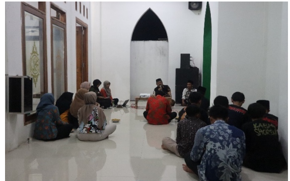
Gambar 8. Sambutan oleh Kepala Desa Tlogorejo