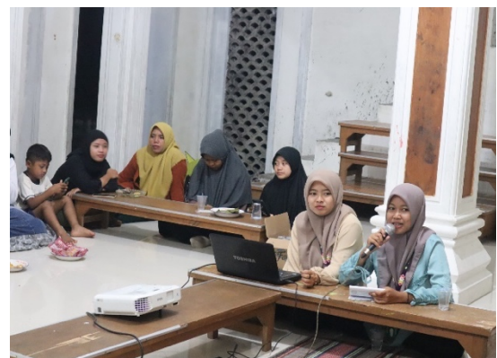
Gambar 10. Pembukaan sosialisasi oleh Moderator