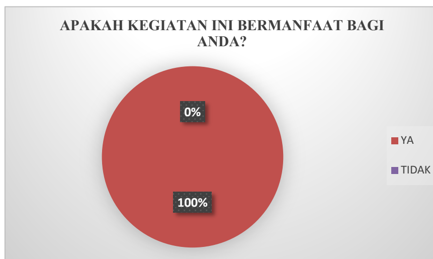
Gambar 3. Hasil Instrumen Kepuasan Peserta Pertanyaan No 1

Pada akhir kegiatan, instrumen kepuasan peserta disebarakan untuk mengetahui bagaimana kepuasan para peserta terhadap keseluruhan dari kegiatan ini. Dari hasil pengisian instrumen kepuasan oleh peserta dapat dilihat pada diagram-diagram pada Gambar 3-6. Hasil responden secara umum dapat dilihat bahwa para peserta sangat antusias mengikuti acara.