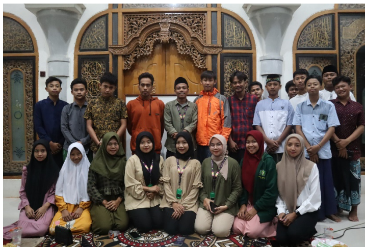
Gambar 1. Peserta dan Tim Sosialisasi

Sosialisasi pencegahan stunting ini merupakan rangkaian kegiatan pengabdian kepada masyarakat yang dilakukan di Desa Tlogorejo, Kecamatan Kepohbaru, Kabupaten Bojonegoro, Jawa Timur. Kegiatan pengabdian kepada masyarakat ini diikuti oleh 17 peserta dan 5 orang dari tim mahasiswa. Tim pengabdian kepada masyarakat dalam kegiatan ini terdiri dari para mahasiswa peserta KKN yang membantu selama berlangsungnya rangkaian acara pengabdian kepada masyarakat ini. Para peserta sosialisasi ini dengan seluruh anggota tim yang terlibat tampak pada Gambar 1 dan pelaksanaan kegiatan pada Gambar 2.