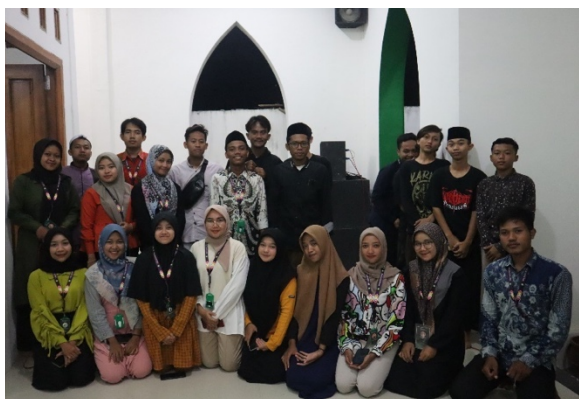
Gambar 9. Peserta sosialisasi pencegahan stunting