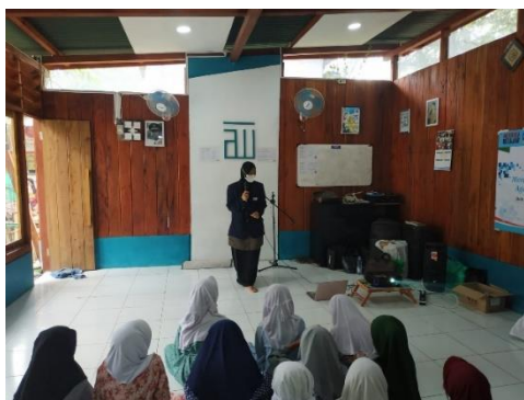
Gambar 4. Pembelajaran Bahasa Arab

Kegiatan pertama yang dilakukan adalah pengajaran ilmu Bahasa Arab dengan melafalkan beberapa kalimat pembuka dan kalimat perkenalan dalam Bahasa Arab. Dari hasil yang telah diajarkan Umi kepada anak-anak Bilik Pintar dapat dianalisis bahwa mereka tidak terbiasa berbicara menggunakan bahasa Arab karena belum mengenal kosakata yang ada di Bahasa Arab. Mereka menganggap Bahasa Arab sebagai bahasa asing yang membutuhkan kosakata-kosakata tertentu untuk dapat menerapkannya. Faktor timbulnya kesulitan dalam pembelajaran bahasa Arab disebabkan beberapa faktor diantaranya faktor linguistik dan faktor non linguistik. Faktor Linguistik yang menandakan bahwa kesulitan itu timbul dari dalam bahasa itu sendiri yang artinya antara bahasa Arab dengan bahasa Indonesia perbedaannya sangat besar sekali baik mengenai kosa kata, tata kalimat, tata bunyi maupun tulisan. Sedangkan Faktor Non Linguistik menandakan bahwa kesulitan itu timbul dari luar bahasa itu sendiri, termasuk bahasa adalah mempengaruhi terhadap pembiasaan pengajaran bahasa Arab (Syardiansah, 2019). Hasil kegiatan ini ditunjukkan dengan peningkatan kemampuan anak-anak dalam Bahasa Arab yang ditandai dengan kemampuan mereka dalam memperkenalkan diri menggunakan Baha Arab di akhir kegiatan. Oleh karena itu, kegiatan ini merupakan langkah awal yang bagus untuk mengenalkan Bahasa Arab kepada anak-anak Bilik Pintar (Amaliah & Prasetyo, 2021; Kadir et al., 2022; Visiaty & Piantari, 2019).