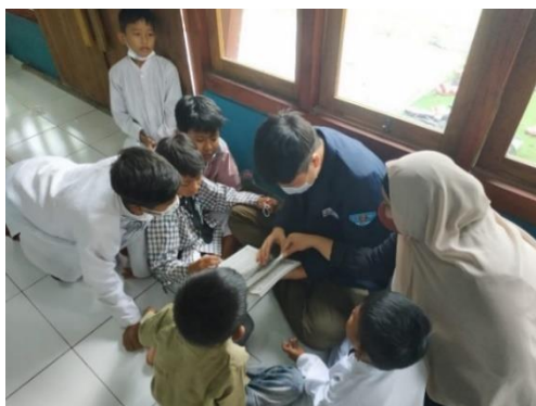
Gambar 5. Pengajaran Membaca Iqra (1)