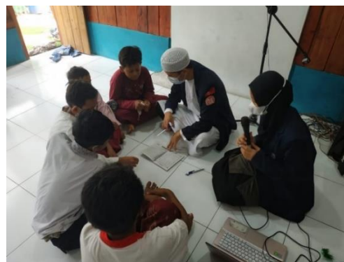
Gambar 6. Pengajaran Membaca Iqra (2)