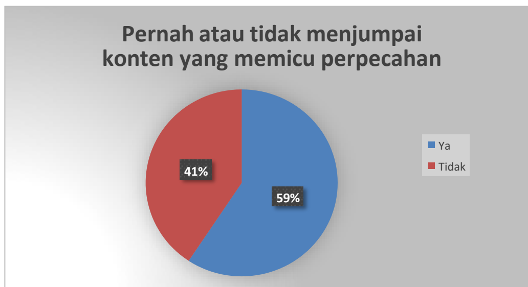
Diagram 5 Konten Islami yang memicu perpecahan umat

Media sosial seharusnya menjadi sarana untuk menyebarkan pesan kebaikan, namun sayangnya banyak pengguna media sosial yang justru memanfaatkannya untuk menyebarkan kebencian dan permusuhan terhadap kelompok atau keyakinan tertentu. Tindakan tersebut jelas bertentangan dengan prinsip dasar berdakwah yang bijaksana dan penuh kasih sayang. Oleh karena itu, penting bagi kita untuk memahami bahwa berdakwah melalui media sosial harus dilakukan dengan cara yang positif, membawa manfaat, dan tidak merugikan pihak lain. Hal ini sejalan dengan nilai-nilai moral dan etika dalam Islam yang mengajarkan kebaikan, kedamaian, dan toleransi antar umat beragama.