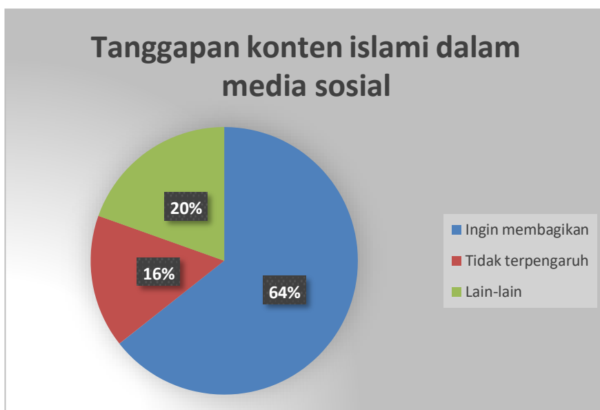
Diagram 3 Tanggapan Konten Islami dalam media sosial

Menurut 5 Aziz dan Zainal (2020) remaja dan pemuda adalah generasi muda yang memiliki potensi besar dalam berdakwah melalui media sosial. Mereka memiliki kreativitas, inovasi, dan kecanggihan dalam menguasai teknologi informasi dan komunikasi. Mereka juga memiliki semangat, idealisme, dan tanggung jawab dalam menyampaikan pesan-pesan Islam. Kelompok remaja dan pemuda memiliki peran yang sangat vital dalam penyebaran dakwah Islam di era digital sekarang ini. Sebagai pengguna aktif media sosial, mereka mempunyai pengaruh yang signifikan dalam memengaruhi pandangan masyarakat dan memberikan pemahaman tentang ajaran Islam secara lebih luas.