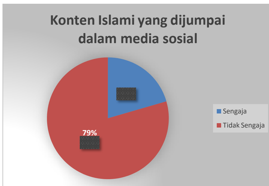
Diagram 2. Konten Islami yang dijumpai dalam sosial media

Berdasarkan diagram tersebut, terlihat bahwa sebagian besar konten islami dijumpai dengan tidak sengaja. Hal ini mampu menjadi kesempatan besar agar sosial media dapat berperan menyebarkan agama islam. Ketidaksengajaan ini bisa menjadi adalah ketukan rahmat sebagai pengingat untuk belajar ilmu agama dan mengingat Allah.